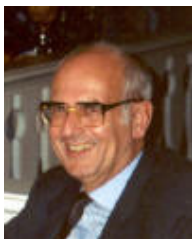
Registrierter Vermittler beim Bundesamt für Privatversicherungen (BPV) – Registernummer 10592